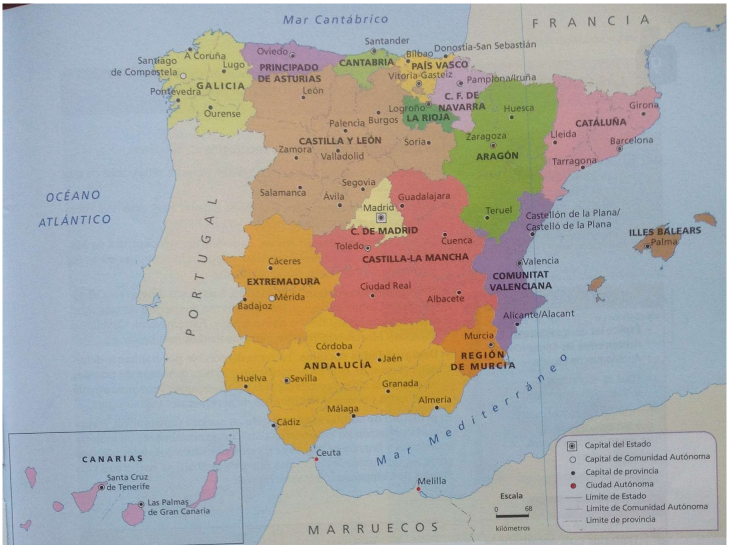
19. MAPA POLÍTICO DE ESPAÑA