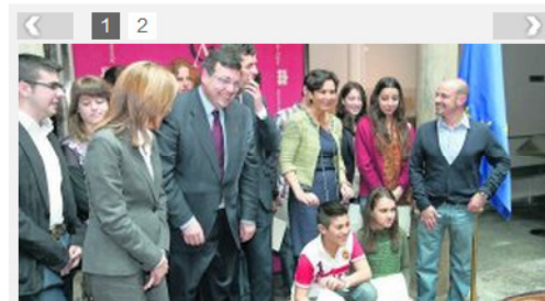
Representantes políticos y estudiantes, distendidos, tras participar en el homenaje a la Carta de los Derechos Fundamentales de la UE.

Las actividad forma parte del programa de la Semana de Europa, que se prolongará hasta el lunes e incluye charlas en el Antiguo Instituto y un ciclo cinematográfico en el Centro de Interpretación del Cine de Asturias, ubicado en el Casino. El próximo lunes, a las 20.30 horas, el Centro Municipal Pumarín Gijón Sur proyectará la película 'Las nieves del Kilimanjaro', premiada por el Parlamento Europeo en 2011.