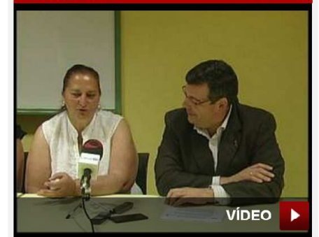
LOCAL Tres mujeres de etnia gitana crean una cooperativa de modistas