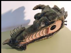
Lira de plata